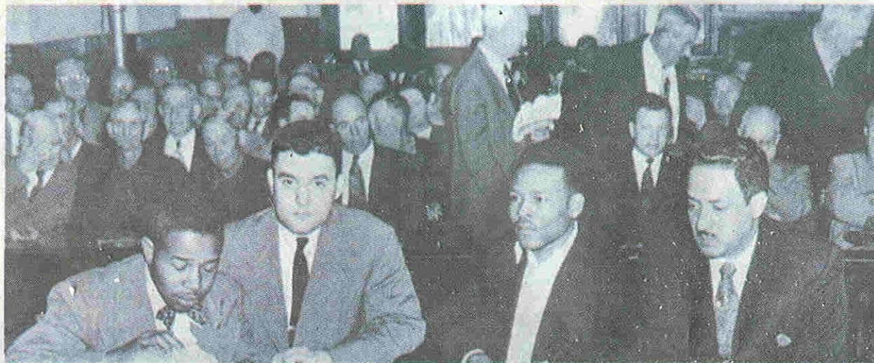
TÁRGYALÁS AMERIKÁBAN. A KÉPEN BALRÓL A MÁSODIK JACK GREENBERG

➔ NÉVJEGY. Jack Greenberg 1924-ben született New Yorkban. Az amerikai polgárjogi mozgalomban ügyvédként tevékenykedett. A '70-es évek óta más országok emberjogi kérdéseivel is foglalkozik, így a volt Szovjetunió volt tagköztársaságaiban, Dél-Afrikában, Magyarországon, Bulgáriában és Szudánban. Tevékenységéért 2001-ben Bill Clinton kitüntette. (Forrás: wikipedia.org)